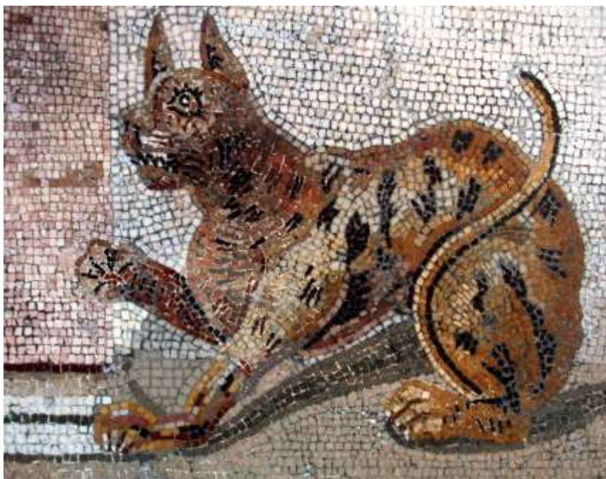
Прародитель Египетской мау – дикая африканская кошка